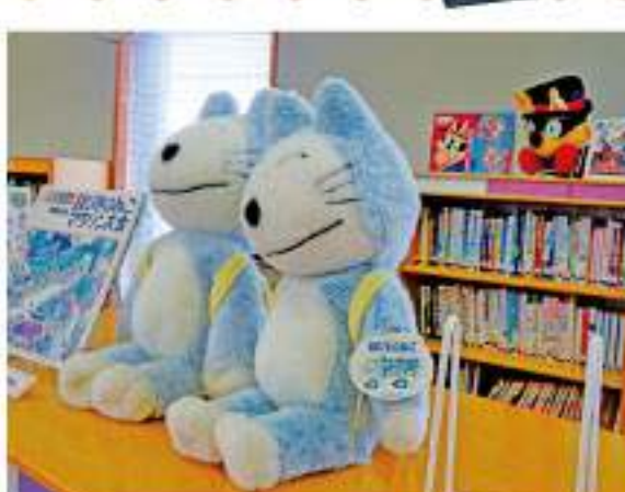
児童コーナーには、本のキャラクターが置いてあるので探しやすいよ!

今回は、瑞穂市の瑞穂市図書館本館と宮田にある瑞穂市図書館分館に行ってきたよ。 瑞穂市図書館には、本館・分館合わせて約25万冊が置いてあるから、気軽に本を探して読んだり、調べ物をしたり、勉強することもできるんだって。もちろん、本探しのお手伝いもしてくれるよ。本のタイトルがわからないとか、漢字と「○○」について調べたい」という時も司書の皆さんがお手伝いしてくれるんだって、うれしいサービスだよな。